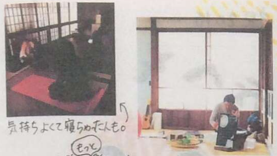
気持ちよくて寝たみたいかも

つむぎでのんびりなイベントを開催しました。 朝ヨガに たたき染め、消しゴムアート、ウクレレを、のんびり、ゆたり楽しみました。 今後ゆる〜く続けていこうと思います。