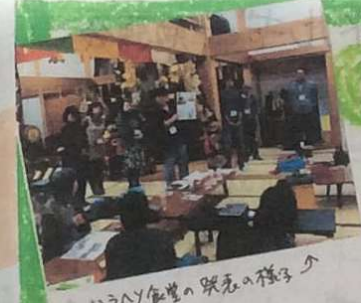
ハラハラ食堂の賑わいの様子

5月から開催されているまちづくり塾も、残り2回になりました。12/20にOPENしたハラハラ食堂を含めて、4つの夢の実現に向けて皆頑張っています。2/12(金)19:00~お茶のみサロンで報告会があるのでぜひお越し下さい!