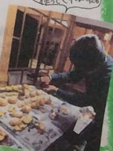
この日は、参加者の方が参加費をスーッと作ってくれました