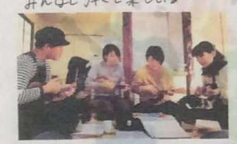
みんな弾くと楽しいよ