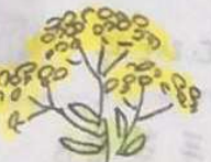
女郎花 オミナエシ