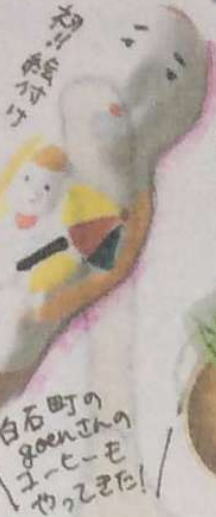
白石町の goenjinの ヨーピーモ やっぴました!

尾崎人形の絵付け体験、 ハンドトリートメント、などなど、 のんびり、でも、と〜っても、 充実の1日 でした。