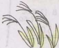
オバナ 尾花(ススキ)