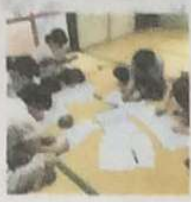
みんなが ホロンとウクレレタイム