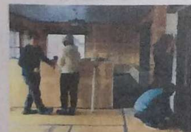
((ムラモトもたまに参加しています。))

有田と大町の協力隊さんが、空き家のリノベーションプロジェクトをスタート。ペンキや塗喰塗り、壁紙貼りなどのワークショップを開催しています。DIY好きの方は、FBページを要チェック!!