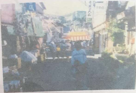
昭和60年頃の 小田商店街

第1回小田宿まつりの時の写真です。 子どもも沢山いて、商店街が賑わっています。 小田宿祭りの前は、現在のサウ食品が ある場所で、「どんどん祭り」というお祭りが あったそうです。